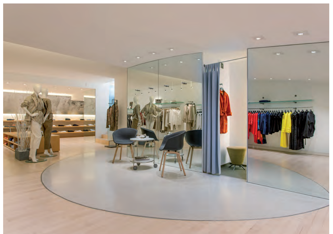
Grosszügige Flächen laden zum Shoppen ein.