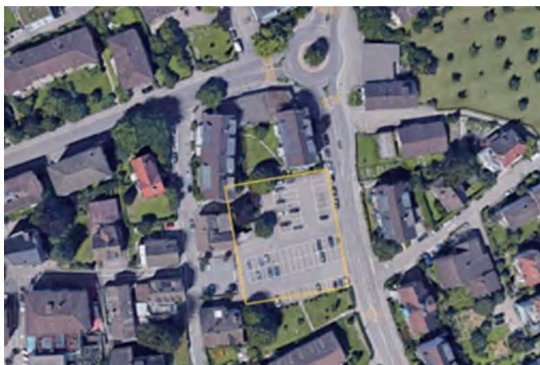
Das Areal des Parkplatzes Alte Landstrasse liegt nördlich der Gemeindeverwaltung zentral in Küsnacht.

In Küsnacht wird immer wieder beklagt, dass es an Wohnungen, Laden- und Gewerbeflächen fehlt und dass bei vielen oberirdischen Parkplätzen die Flächen nicht effizient genutzt werden. Aus diesem Unmut heraus ist eine überparteiliche Einzelinitiative entstanden.