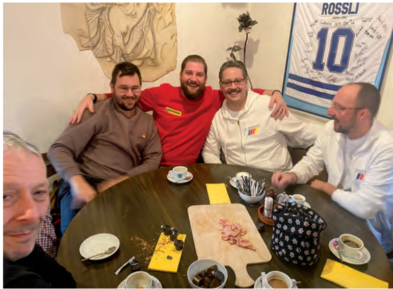
Gemütliches Beisammensein bevor es in die Weihnachtsferien geht.