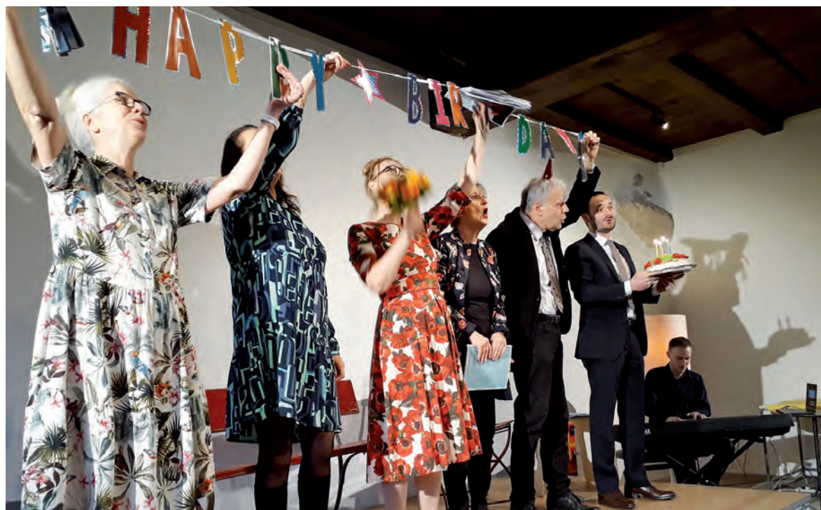
Die Kulisse feiert 40 Jahre Kultur in der Oberen Mühle.