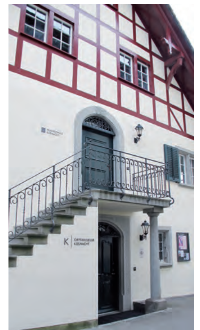
Obere Mühle: Tobelweg 1, unten Ortsmuseum Künsnacht, oben Musikschule Künsnacht.