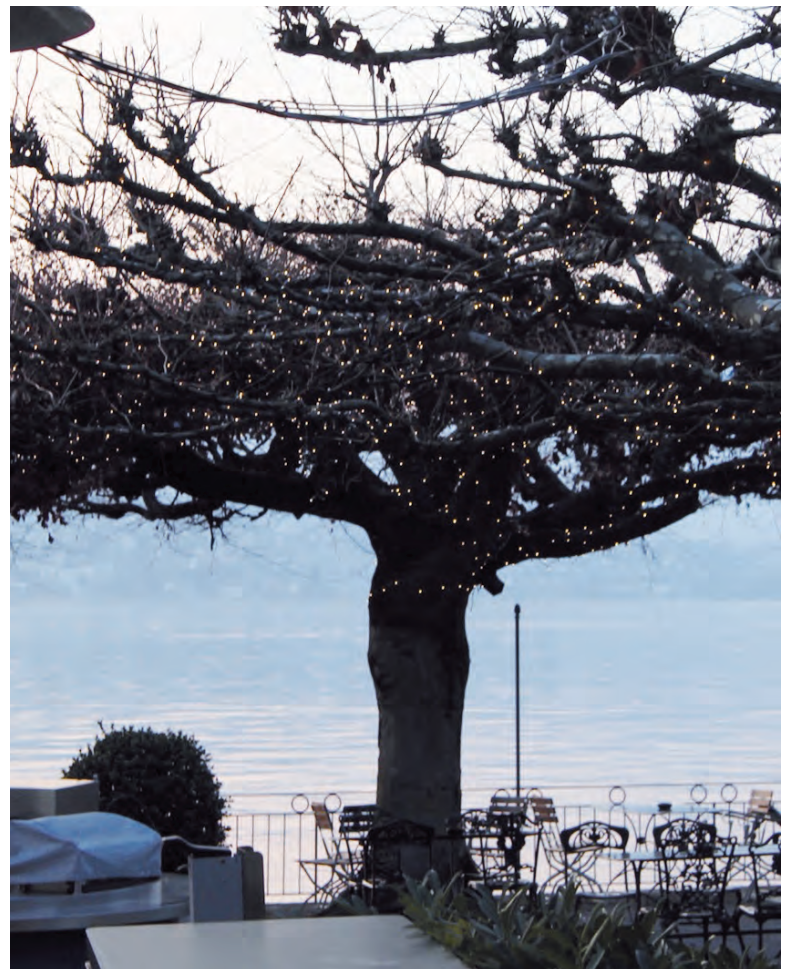
Blick über den winterlichen See vom Romantikhôtel Sonne.