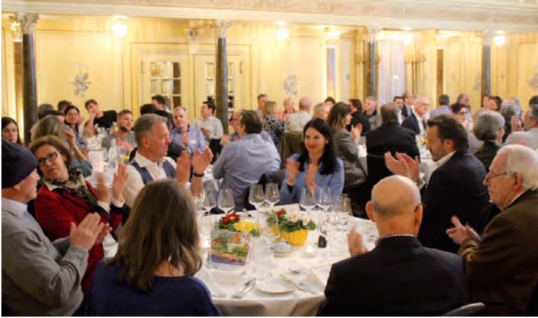
Applaudierend werden alle Traktanden einstimmig angenommen.