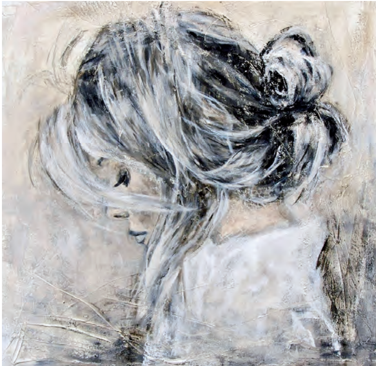
Verletzlichkeit und Echtheit – wahre und ehrliche Schönheit.

Was ist wahre Schönheit? Ist es die innere Schönheit, wodurch die Wesenszüge einer Person erfahren werden? Oder sind es die äusseren Merkmale wie einen vollen Mund, grosse Augen und die perfekte Nase, die im richtigen Verhältnis zueinanderstehen? Fakt ist, dass Schönheit subjektiv empfunden wird und die Vorstellung von wahrer Schönheit rund um die Welt könnte unterschiedlicher nicht sein.