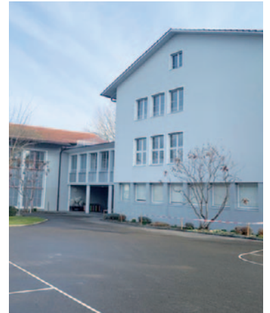
Schon bald bezieht die Schule DEDUCA die Räume des Schulhauses Erb.