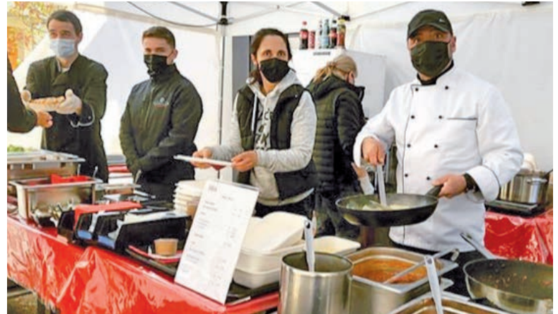
Die Falken-Crew schwingt wieder die Löffel und verkauft Take-Away.