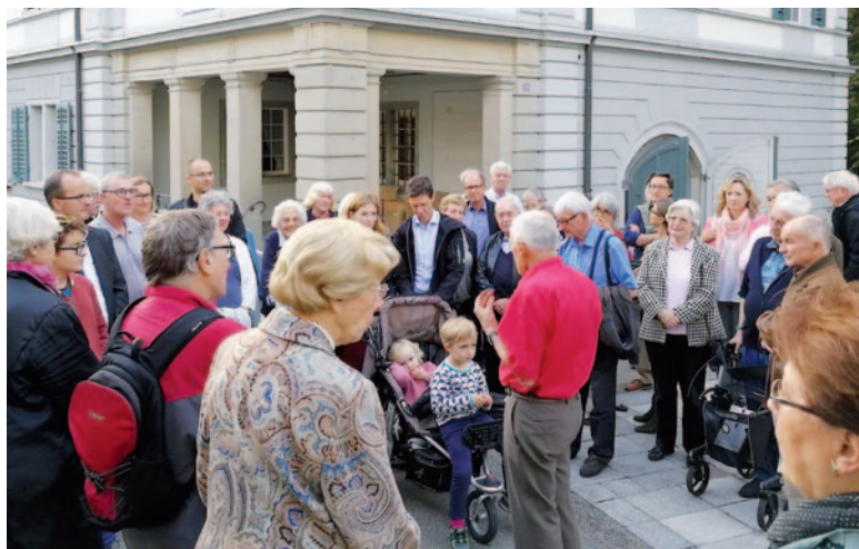
Ja, es gab mal eine Zeit mit viel Nähe und keinen Masken: Kulturnacht 2017.

Das OK musste deshalb zum jetzigen Zeitpunkt einen Entscheid fällen, der eine sichere Durchführung gewährleistet. Nach einigen Überlegungen und Vorabklärungen zu Alternativen hat es sich dann schliesslich für die virtuelle Version entschieden. Gerade in Zeiten der vielen abgesagten Anlässe bietet dies auch für die Künstlerinnen und Künstler einen kleinen Lichtblick mit einem sicheren Auftritt.