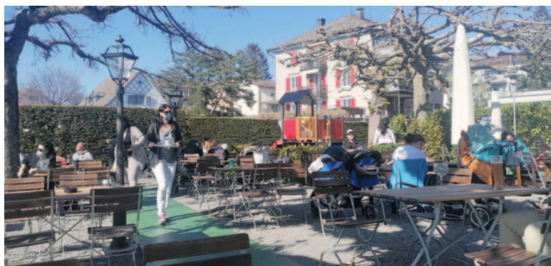
Die Terrasse des Romantikhôtels Sonne profitierte schon letzten Sommer von Daheimgebliebenen und Hotelgästen.

Hotel, Garten und Restauration werden gut laufen. Gespannt sind wir auf den Bankett/Seminarbereich über den Bundesratsentscheid Ende Mai.