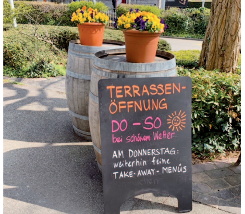
Das Kafi Carl hätte im Frühling 2020 neu eröffnet werden sollen – zum Leidwesen des Gastgeberpaars wütet seit der Eröffnung Corona.

Aus Kostengründen haben wir entschieden nur an vier Tagen zu öffnen: Donnerstag und Freitag 9 bis 18 Uhr, Samstag und Sonntag 9 bis 17 Uhr.