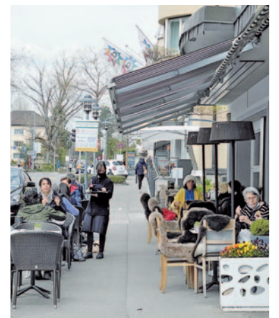
Endlich wieder möglich: Nach dem Fitness «eins trinken».

Ja, da ich draussen praktisch gleich viele Plätze wie drinnen habe. Bei Regen habe ich einen Teil unter dem Dach. Und es ist so schön, wie die Gäste strahlen, dass sie sich endlich wieder treffen können!