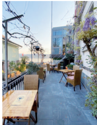
Ferienfeeling pur: Restaurant Steinburg

Dazu kann und möchte ich mich momentan nicht äussern. Mein Team und ich machen das Beste aus der momentane Lage, wissen aber nicht, wo die Reise hingeht und was die nächsten Jahre bringen.