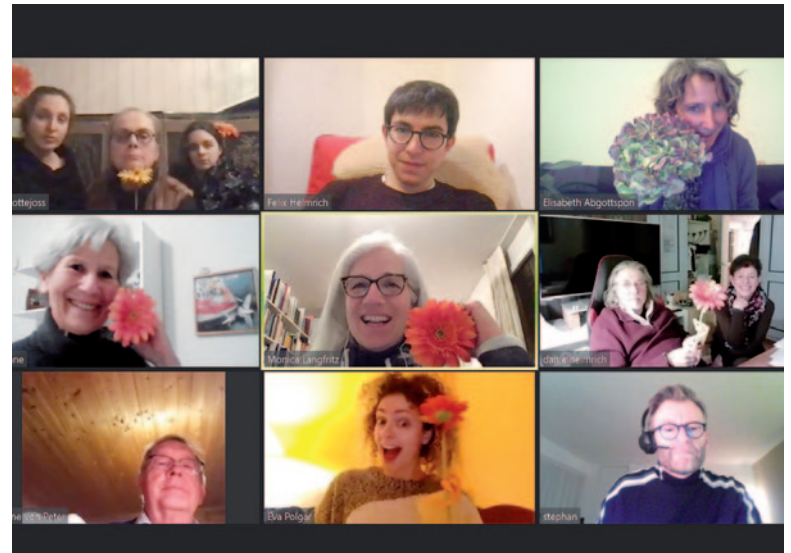
Das aktuelle Ensemble, die Regie und ein Teil des Vorstandes bei der Abschieds-Video-Konferenz am 7. Januar 2021.

Der Küssnacher Theaterverein «Die Kulisse» hat bis fast zuletzt an die Kraft der Kreativität geglaubt und sein Pro-