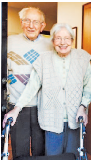
Küssnacher Senioren haben gut lachen: Verschiedene Institutionen kümmern sich um sie.