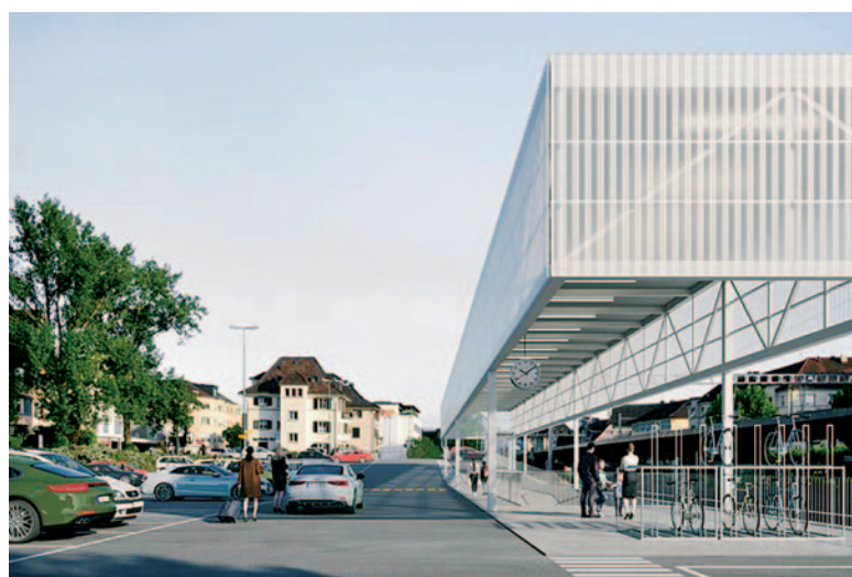
Das bergseitige Dach soll als offenes und einladendes Wahrzeichen beim Bahnhof Küssnacht erstrahlen.