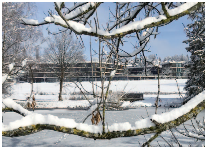
Senioren werden immer älter und wollen den Einzug ins Altersheim hinausschieben.