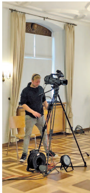
Ins rechte Bild gerückt: Dank flexiblen Helfern kein Problem.

Musik hat einen direkten Zugang zu Emotionen und die Kraft, sich mit den aktuell fehlenden Bedürfnissen des sozialen Lebens auseinander zu setzen. Mit der digitalen Bühne «musicstage» leisten wir einen kulturellen Beitrag für unsere Bevölkerung. Älteren Menschen, Seniorenheimen oder anderen Neueinsteigern in die digitale Konzertwelt bieten wir zudem technische Unterstützung. e