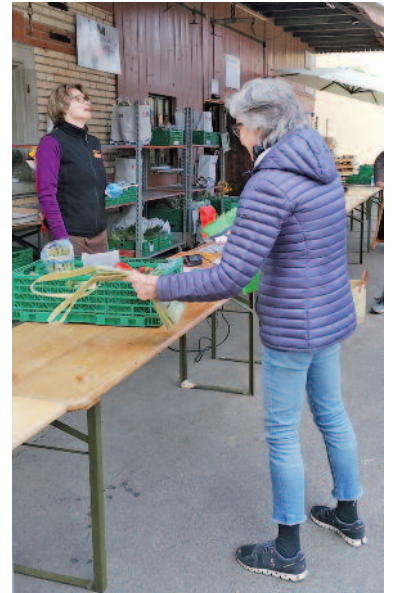
Beliebt: Bei Grimm gibt's Blumen, Gemüse und Obst über die Gasse.

So lange noch kein Ausgangsverbot gilt, sollte man die Natur geniessen, vor allem an so herrlichen Frühlingstagen! Es ist an der Zeit, Gemüsesetzlinge ein-