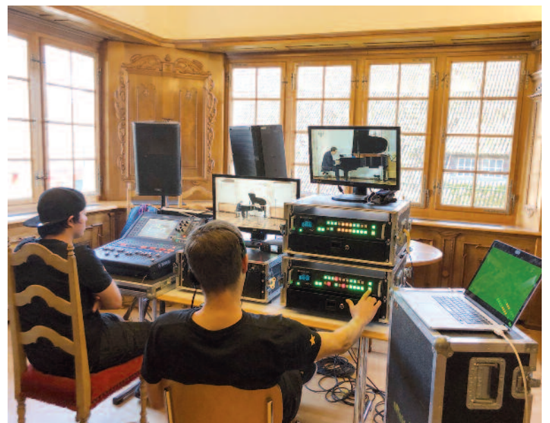
Die Qualität muss stimmen. Gerade bei Klassikkonzerten reicht die Aufnahme via Smartphone nicht aus.