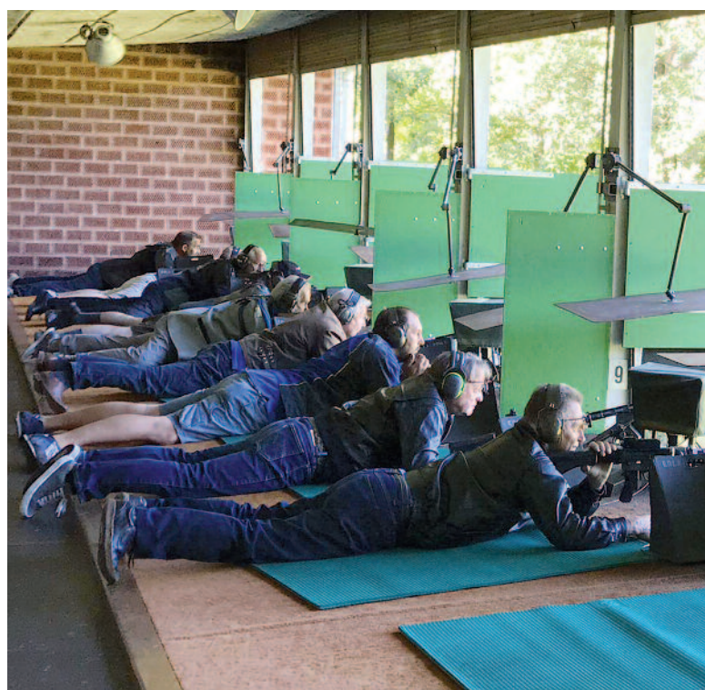
Gehört das Schiessen im 2020 bereits der Vergangenheit an bevor es überhaupt angefangen hat?

Eine harmonische GV in einem wahrscheinlich denkwürdigen Vereinsjahr nahm so seinen Abschluss.