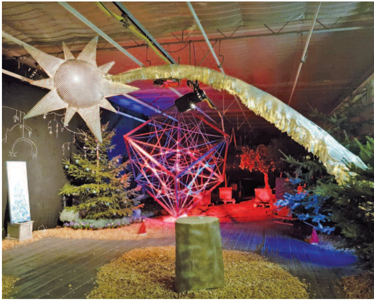
Zusammensitzen, Glühwein trinken, Kunst bestaunen: Advent in Küssnacht.

Die Gärtnerei Karrer veranstaltet Adventsfenster schon lange. Die Idee des Adventsfensters wurde vom Gewerbeverein nun zum ersten Mal aufgegriffen und es machen bereits 24 Geschäfte mit. Jeden Tag ein anderes. Die Gärtnerei Karrer wird am «Glücksfreitag», 13. Dezember ab 18 bis 21 Uhr ihr «Gartentor» für ein gemeinsames weihnachtliches Einstimmen öffnen. e