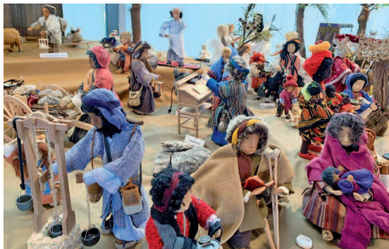
Mehr als Ochs und Esel: In der Krippe der Feldmanns sind über 60 selbstgemachte Figuren ausgestellt.

halde in Lebkuchenform abgebildet. Auch die dort arbeitenden Berufsgruppen hat die Köchin kunstvoll und ver-