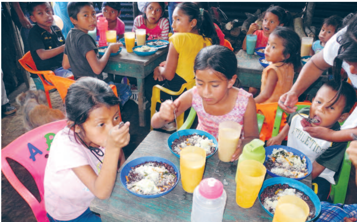
Projekt Vamos Adelante in Ceylan: Suppenküche und Bibliothek für die indigene Bevölkerung.

Infos zur 26. Generalversammlung Verein Guatemala-VGZ (ohne Anmeldung) Montag, den 22. Mai, um 19.30 Uhr im Foyer der HesliHalle, Untere Heslibachstrasse 33, Küssnacht