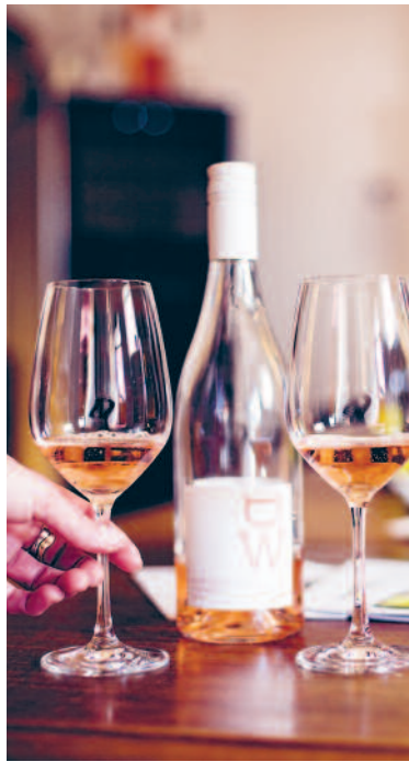
Ein besonders schöner Tropfen: der Rosé de pinot noir 2016.

Auf dem Vorplatz und in den Räumlichkeiten konnten die Gäste die Besonderheiten des Jahrgangs 2016 entdecken. Peter Häuselmanns Küche verwöhnte die Gäste mit gebackenen Felchen-Filets oder Hecht aus dem Zürichsee. rew