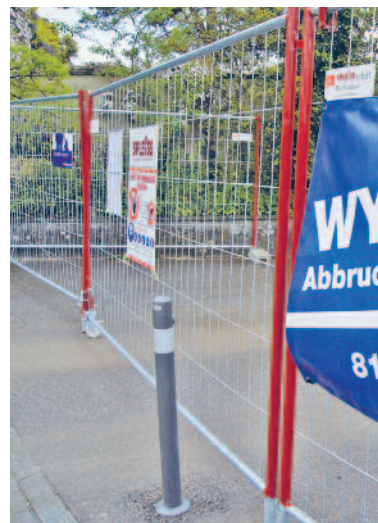
Baustart Betreuungshaus: Sicherheit geht vor! An der Oberen Wiltisgasse 28 haben die Aushubarbeiten begonnen – voran geht ihnen ein detailliertes Sicherheitskonzept der Gemeinde Küssnacht.

Während der Abbruch-, Aushub- und Rohbauphase ist mit vermehrtem Lastwagenverkehr zu rechnen. Daher hat die Schule zusammen mit der Politischen Gemeinde und der Kantonsschule ein Sicherheitskonzept ausgearbeitet, das bis Ende der ersten Schulwoche nach den Frühlingsferien umgesetzt wird. Ein Sicherheitsbeauftragter der Securitas