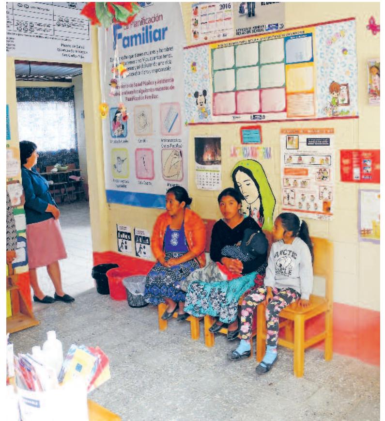
Frauen warten in einer vom Verein gebauten Landklinik auf ihren Termin.