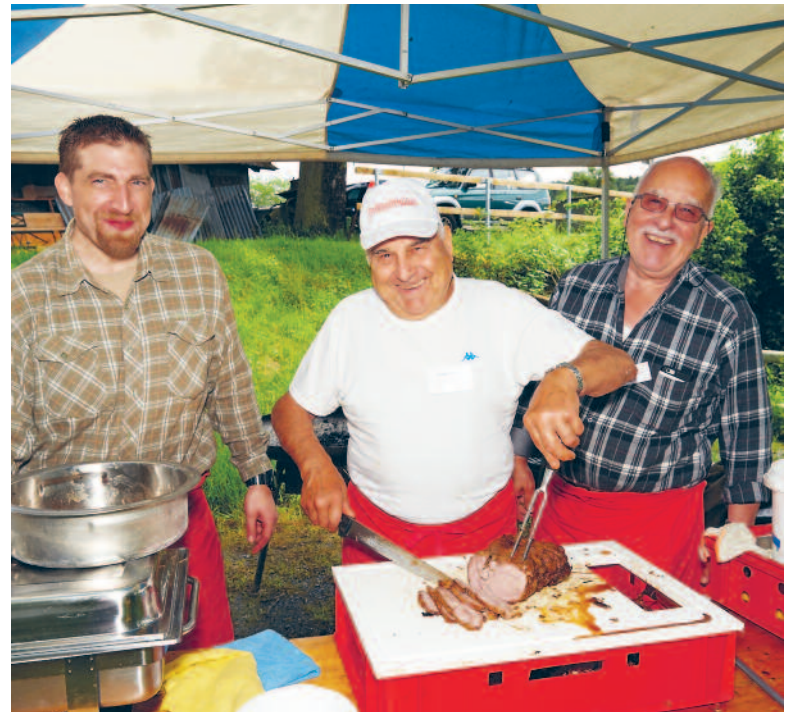
Da wird jeder Fleischliebhaber fündig: Schlachthüüslifäscht vom 10. Juni.

Samstag, 10. Juni, 10 bis 17 Uhr, Schlachtlokal, Wangen 17, Forch