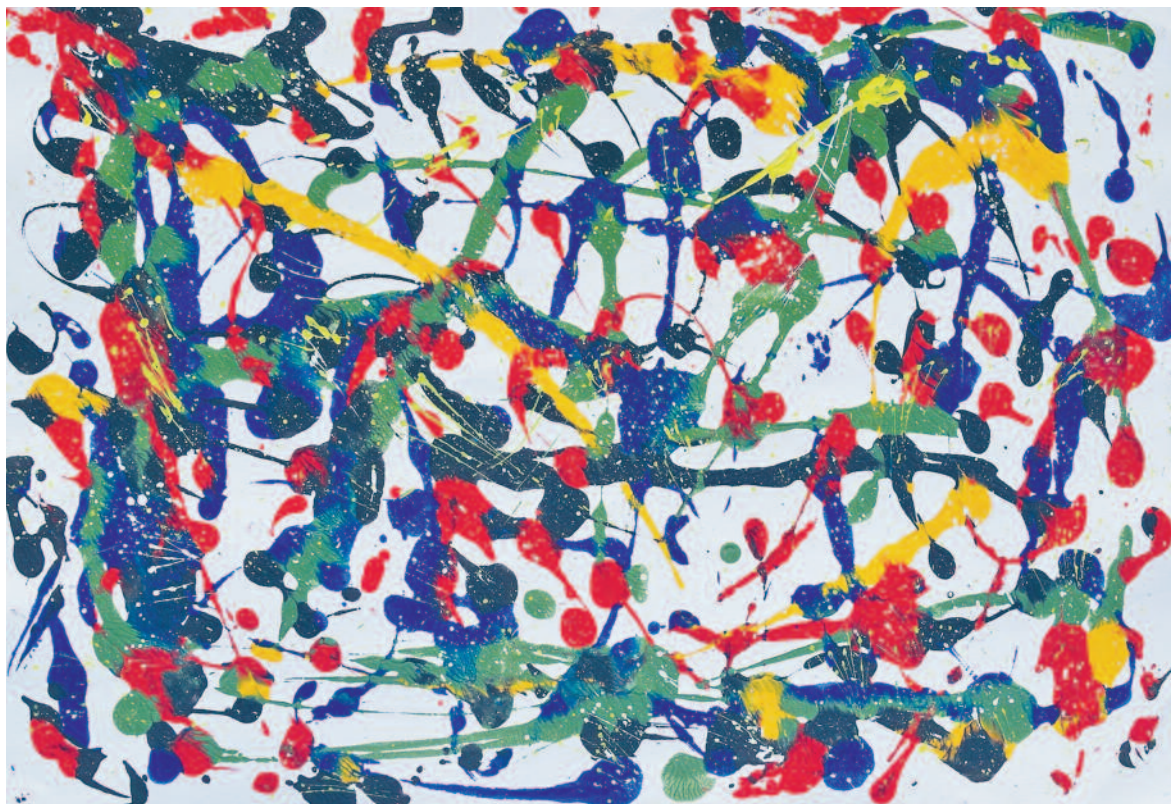
Acryl auf Papier von Ruedi Stüdeli

Infos Ausstellung von Ruedi Stüdeli in der Galerie Höchhuus Küsnacht Öffnungszeiten Ausstellung: 5. bis 21. Mai, Freitag, 17 bis 19 Uhr, Samstag und Sonntag, 14 bis 17 Uhr und nach Vereinbarung Finissage: Sonntag, 21. Mai, 14 bis 17 Uhr Galerie im Höchhuus Küsnacht, Seestrasse 123, 8700 Küsnacht, Tel. 076 380 40 96 Weitere Informationen: Galerie im Höchhuus Küsnacht, www.kulturelle-vereinigung-kuesnacht.ch > Galerie im Höchhuus Küsnacht