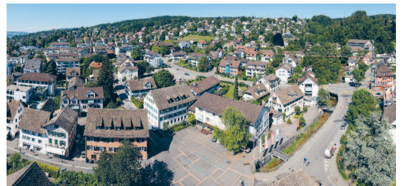
Künsnacht soll für alle attraktiv sein.